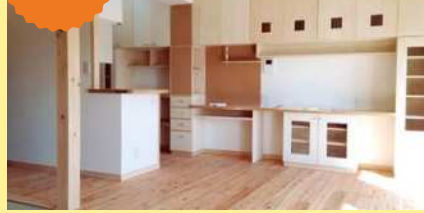
設計 小野建築設計室 施工 株山園工務店