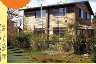
設計 DEN設計工房 施工 はなぶで建設