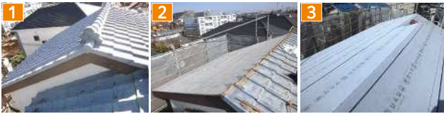
1 工事前は古い瓦屋根 2 瓦をおろし下地をチェック 3 下地材を施工