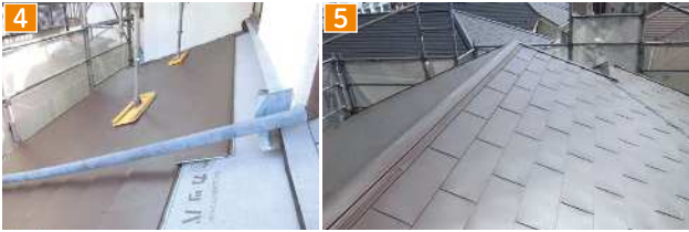
4 軽量のガルバリウムの屋根材 5 完成。美しい仕上がります