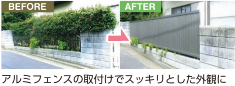
アルミフェンスの取付けでスッキリとした外観に