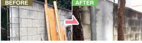
鉄筋コンクリートの控え壁を設け、古いブロック塀の転倒防止補強工事が可能です。この施工方法で、経済的な負担が軽減されます。