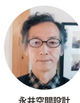
永井空間設計 永井 幸

夏の暑さ、冬の寒さから身を守る住まいのあり方、暮らし方を考えます。法改正で省エネ基準を満たさないと建てる事ができません。