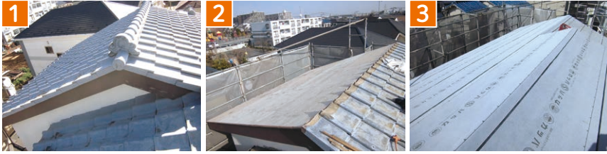
1 工事前は古い瓦屋根