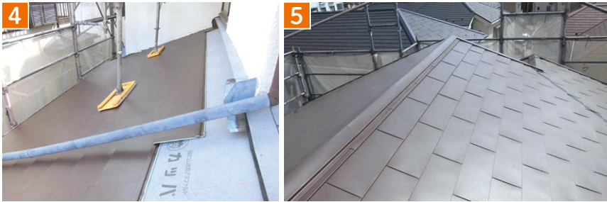
4 軽量のガルバリウムの屋根材