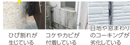
ひび割れが生じている コケやカビが付着している 目地や窓まわりのコーキングが劣化している